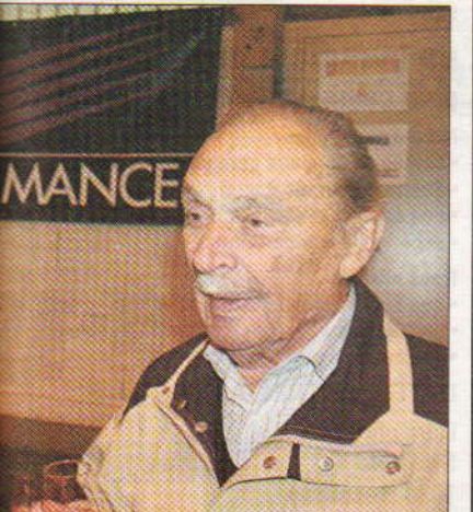
Le plus ancien et le plus long président du TCE.