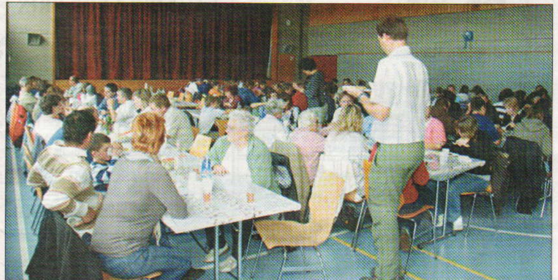
120 accordéonistes, ils causent quand ils ne jouent pas!