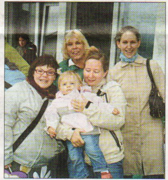
Tout sourire, l'équipe du Bouvreuil de Villars-le-Terroir.